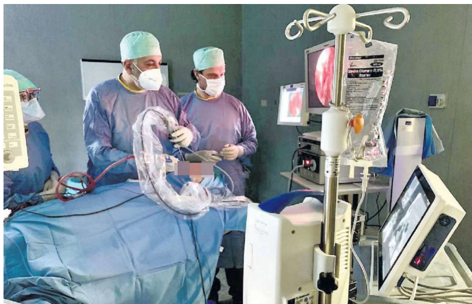
SPECIALIZZAZIONE Tre direzioni distinte all'Ulss 3 Serenissima per le prestazioni di otorinolaringoiatria

► Oltre duemila ricoveri e 63mila attività ambulatoriali negli ospedali dell'Ulss 3 ► Direzioni separate per le specializzazioni in chirurgia, impiantologia e audiologia