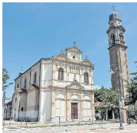
SAN GIORGIO La chiesa di Chirignago

L'UOMO VIVEVA ED ERA CRESCIUTO A CHIRIGNAGO FUNERALE QUESTA MATTINA ALLE 11 A SAN GIORGIO